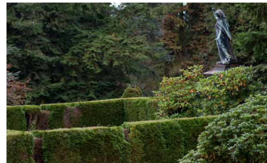
Keine offenen Posten, keine Liquiditätsengpässe, kein Risiko. Das ist ein guter Vorsatz, den die ADELTA.FINANZ für Bestattungsunternehmen in die Tat umsetzt.

torien etc. werden erleichtert: Die Liquiditätsengpässe, die meist als Kettenreaktion auf beiden Seiten entstehen, werden eliminiert. Ohne die betrieblichen Prozesse ändern zu müssen, unterstützt die ADELTA.FINANZ ihre Kunden im Working Capital Management, das einen wesentlichen Baustein für eine erfolgreiche Unternehmensstrategie darstellt. Nachweislich optimiert der Einsatz von ADELTA.BestattungsFinanz die Zahlungsströme und steigert somit den Cashflow. Das beeinflusst nicht nur die Bilanzkennzahlen positiv, das Bestattungsunternehmen gewinnt auch mehr Zeit für sein Kerngeschäft.