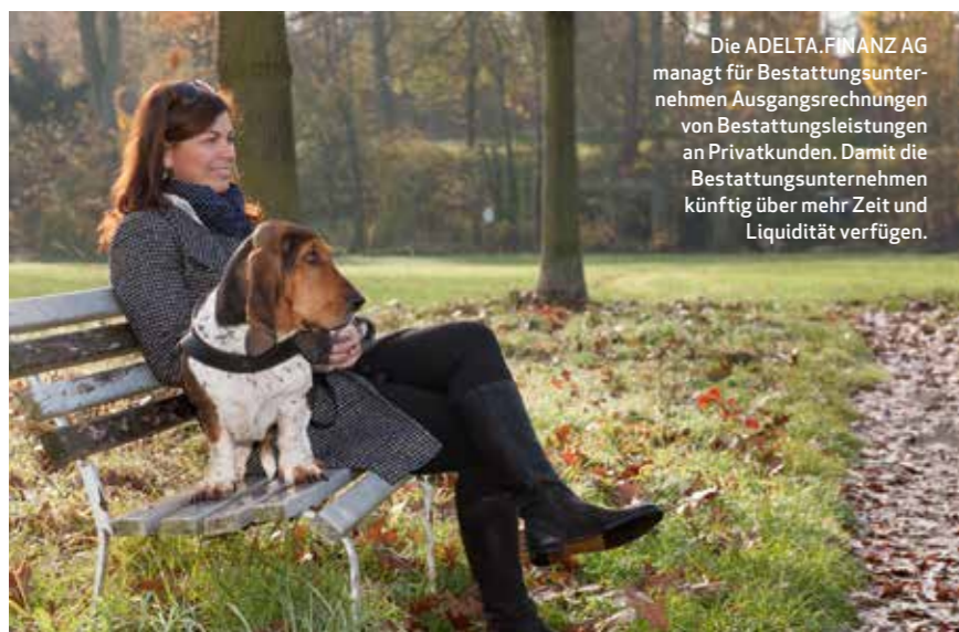
Die ADELTA.FINANZ AG managt für Bestattungsunternehmen Ausgangsrechnungen von Bestattungsleistungen an Privatkunden. Damit die Bestattungsunternehmen künftig über mehr Zeit und Liquidität verfügen.